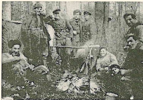
UPA-Kämpfer auf der Rast

Marsch durch rumänisch-ukrainische Dörfer fort. Sie durchstreifte die Gegend um die Städte Vichev und Sigei. In den einzelnen Dörfern verweilte die Abteilung ein bis zwei Tage lang. Die