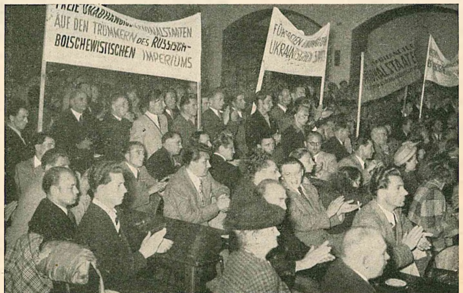
Blick auf den Versammlungssaal — Teilnehmer mit Transparenten

Abgesehen davon, daß die unterdrückten Nationen in der UdSSR das Recht auf ihrer Seite haben, auch die eigene Unvernunft des Westens und die zunehmende Gefahr . . . werden selbst für die nebulose westliche Denkart immer klarer, was bestimmt zu einem Resultat führen wird.“