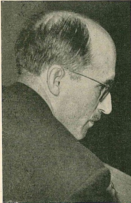
Präsident des ABN, Jaroslaw Stetzkó

der furchtbarsten bolschewistischen Verfolgungen geben die Völker diesen Kampf nicht auf. Kaum ein halbes Jahr ist vergangen, seit die Nachricht vom Tode des im Kampf gegen MWD-Divisionen gefallenen Oberbefehlshabers der UPA, des Führers des Revolutions-