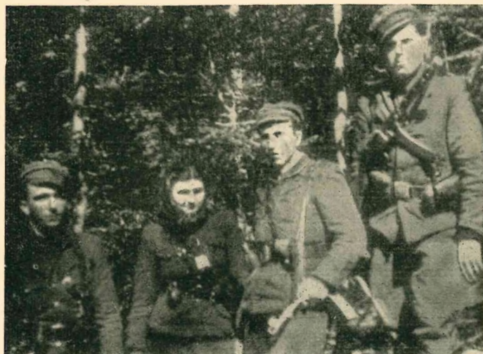
Aus dem Leben der UPA Kreiskommandeur mit seinem Stab in den Wäldern der unterjochten Heimat

bindungen, wie z. B. die Eisenbahnstrecke zwischen den Städten Ru-zomberok u. Poprad im Waagtag, auf welcher auch die tschechoslovakischen Warenlieferungen nach der Sowjetunion befördert werden. Innerhalb einer Woche sollen auf dieser Strecke wenigstens drei Anschläge durchgeführt worden sein.