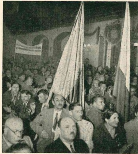
Eine nationale Gruppe mit Fahne

tigung mit den Völkern der freien Welt hinsichtlich der Prinzipien der Atlantikcharta und den Grundsätzen der Vereinten Nationen. Wir fordern die Zulassung von Vertretern unserer Völker zu allen Institutionen der Vereinten Nationen, und zwar solchen, die den national-revolutionären Widerstandskampf gegen den russisch-bol-