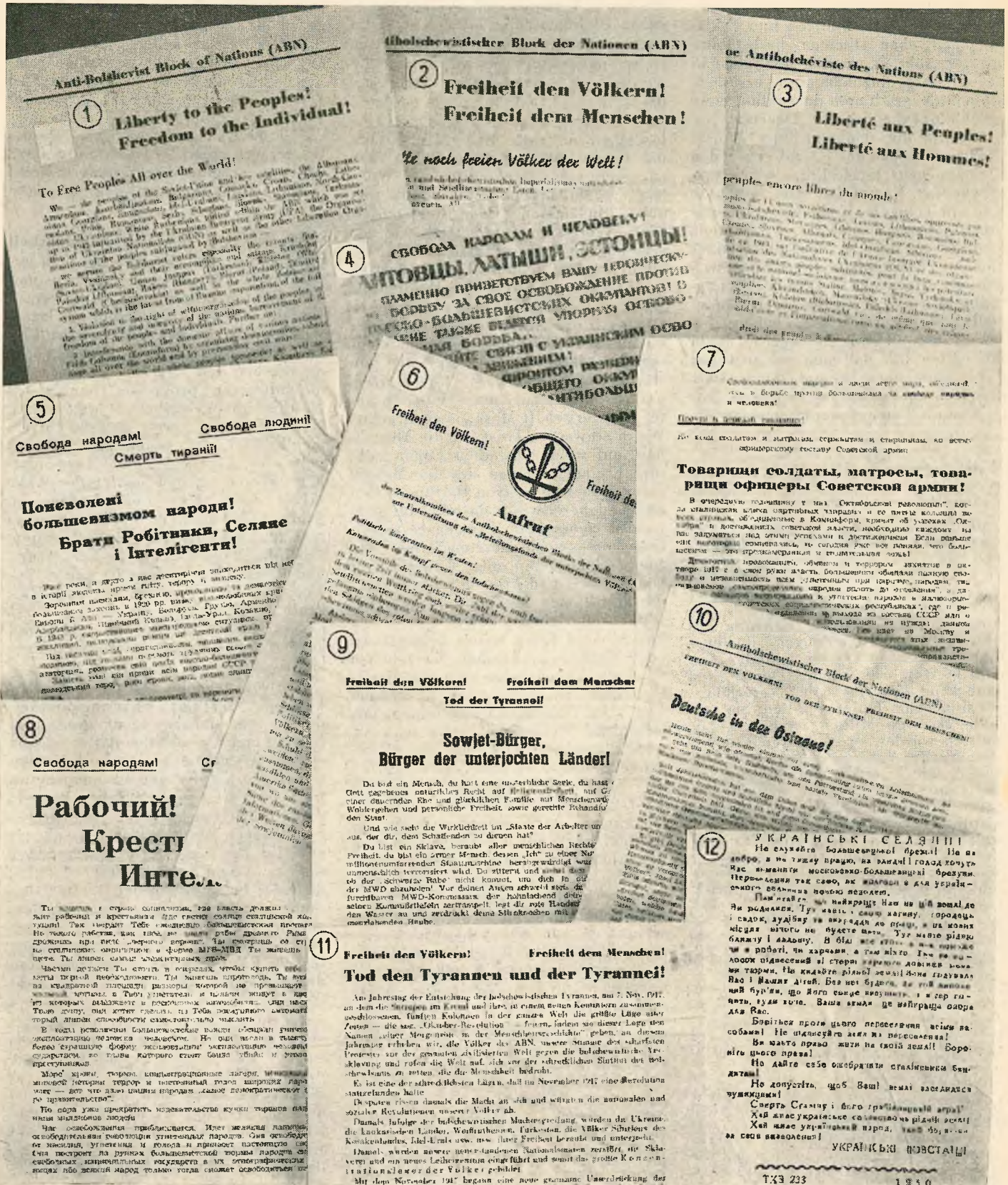
Aufrufe und Flugblätter des ABN die im Jahre 1950 in verschiedenen Sprachen heidessens des Eisernen Vorhangs verbreitet wurden:

In den Aufrufen Nr. 1-3 wendet sich das Zentralkomitee des ABN an die noch freien Völker der Welt mit der Warnung vor der russisch-bolschewistischen Gefahr und mit der Aufforderung zur gemeinsamen Aktion: im Aufruf Nr. 4, in russischer Sprache, wird den nationalen Befreiungsorganisationen der Litauer, Letten und Esten die Bedeutung einer Koordination des Befreiungskampfes mit den anderen vom Bolschewismus unterjochten Völkern dargelegt. Aufruf Nr. 5 fordert die ukrainischen Arbeiter, Bauern und die