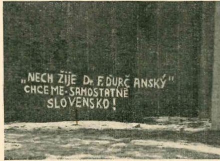
Aus der versklavten Slowakei

Ungeachtet der blutigen Opfer, die das slowakische Volk täglich bringt, läßt es in seiner Forderung nach einer eigenen slowakischen Republik nicht