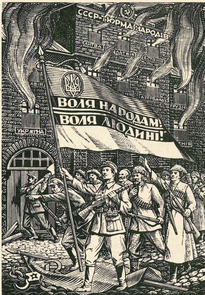
9/50 Ein Flugblatt, das von der Ukrainischen Aufständischen Armee hinter dem Eisernen Vorhang verbreitet wird. — Auf dem Bilde sieht man die einzelnen Kämpfer der Völker des ABN.

Die Aussiedlungsaktion hat besonders in den westukrainischen Bezirken bedrohliche Formen angenommen. Es vergeht kaum ein Monat, in dem nicht ein Transport von ukrainischen Familien nach dem Osten abgehen würde. Die „Organisierung“ solcher Transporte erfolgt gewöhnlich in der Nacht und wird mit einem starken Aufgebot an Polizei durchgeführt. Um nur ein Beispiel von vielen zu nennen, sei hier erwähnt, daß im Dorfe Oriw, im Bezirk Drohobytsh, ein Polizeiaufgebot von rund 80 Mann notwendig war, um im Laufe einer Nacht 67 Personen für den Abtransport nach dem Osten buchstäblich „einzufangen“ und wegzubringen. Daß es hierbei nicht ohne blutige Gewalttätigkeit, Raub und Mißhandlungen abging, braucht nicht weiter ausgeführt zu werden. An Stelle der verschleppten ukrainischen Familien werden nach einiger Zeit Russen oder Mitglieder der Völker aus Asien angesiedelt. Der Zweck einer solchen „Siedlungspolitik“ liegt auf der Hand.