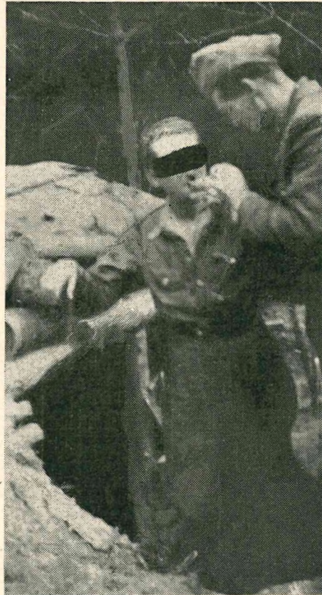
Sanitätsbunker der UPA

sen lebte. Auf dem Lande dagegen, wo die Bevölkerung fast rein ukrainisch ist, gab es auch nie irgendwelche Judenpogrome. Im Gegenteil: Zur Zeit der Pogrome flüchteten die Juden massenhaft in die ukrainischen Dörfer, wo sie bei der Bevölkerung Schutz und