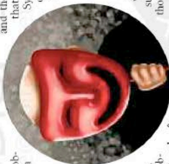
By A. SHAMS/ICGulf News

For full article, log on to www.gulfnews.com/opinions