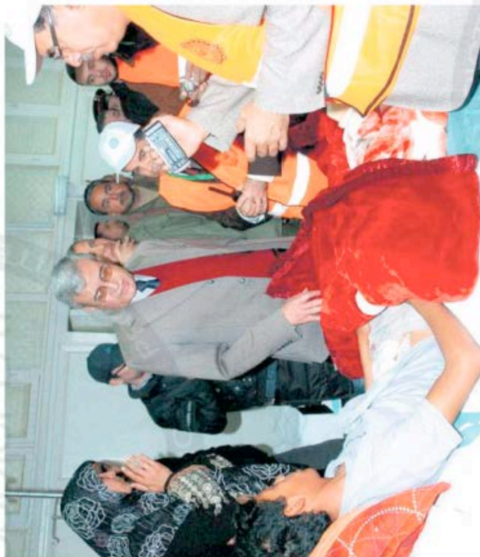
Une délégation d'observateurs (en veste orange ou jaune) à l'hôpital de Daraa, au sud de la Syrie.

A Londres, l'Observatoire syrien des droits de l'homme prétend que les délégations d'observateurs ne sont pas emmenées là où il le faudrait. Et de citer l'exemple