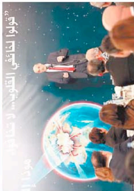
Le chef des FL prononçant son discours.

il adopte un projet qui n'a pas de chance de voir le jour. Ce donquichottisme est honteux et cela devrait suffire à ceux qui se respectent au sein du gouvernement pour qu'ils présentent leur démission », a-t-il dit.