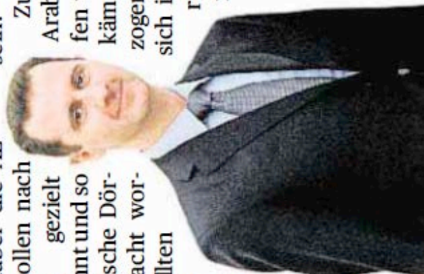
Baschar el Assad

Zuletzt soll Assad laut al-Arabi immerhin schwere Waffen und Panzer aus den umkämpften Städten zurückgezogen haben. Die Armee ziehe sich inzwischen an die Stadtränder zurück. Sollte Damaskus aber nicht vollständig einlenken, seien verschärfte Maßnahmen gegen Syrien nicht mehr auszuschließen. mbr