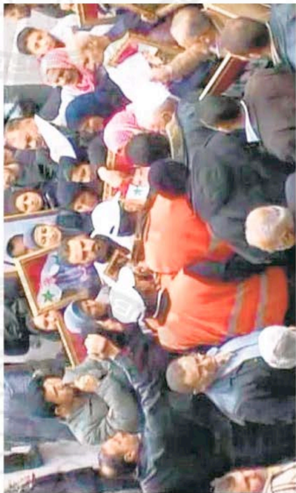
Arab League observers, in orange jackets, talked to Syrians in Idlib province on Sunday, in this government-released photo.

The monitors are expected to verify the Syrian regime's compliance with an Arab League-brokered agreement that stipulates that President Bashar al-Assad withdraw security forces from city streets, release political prisoners, allow access to foreign journalists and human-rights workers and begin talks with political opposition groups.