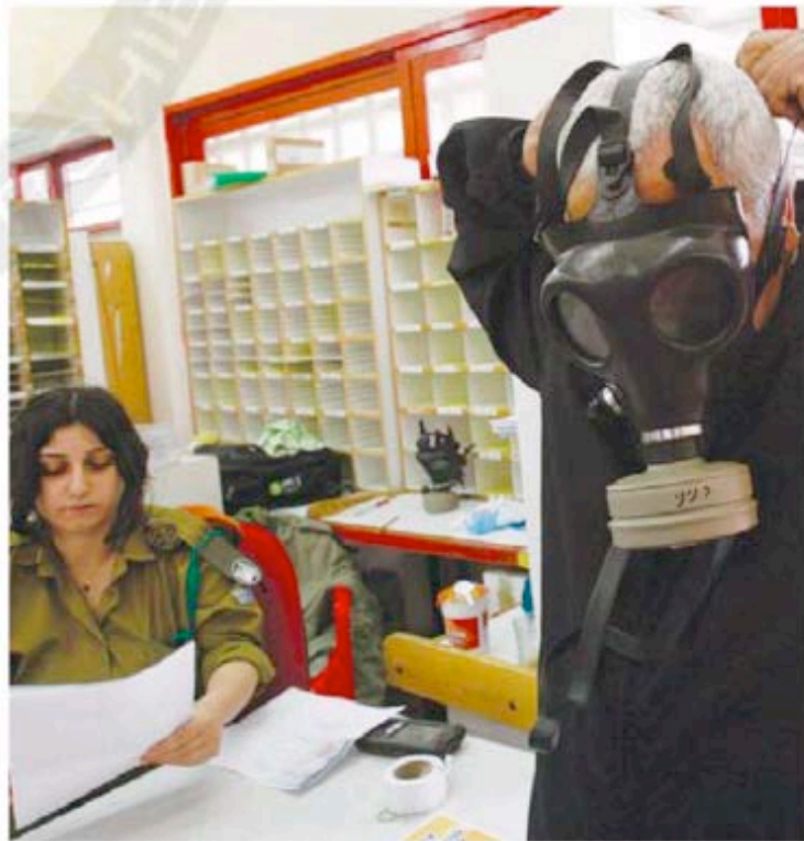
A MAN tries on a gas mask in Tel Aviv last year. Only about 60% of Israelis have one.

Concern over the stability of Syria's chemical arsenal comes at a time when only