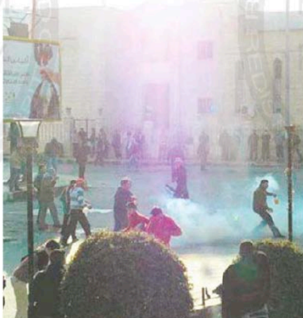
Des manifestants antigouvernement cachent leur visage pour se protéger des gaz lacrymogènes envoyés par l'armée à Idlib, en Syrie, le 30 décembre dernier.

Par ailleurs, les importantes manifestations de la semaine dernière, alors que les observateurs étaient sur place, de même que les quelques entretiens isolés qu'ils ont pu avoir avec des opposants, sont considérés comme des signes positifs. « Ne nous précipitons pas, attendons le rapport de la Ligue arabe, en espérant