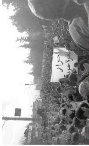
Des centaines de personnes ont défilé hier contre le régime à Maarret Hamra.

La mission des observateurs arabes est contestée également par les opposants syriens qui accusent le régime d'entraver leur mission et d'espionner des