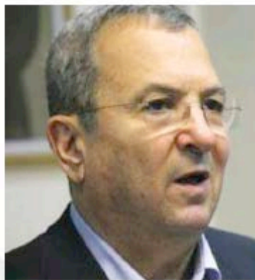
EHUD BARAK (Marc Israel Sellern)

Iran is also facing increasing pressure from the international community, which recognizes Tehran's efforts to