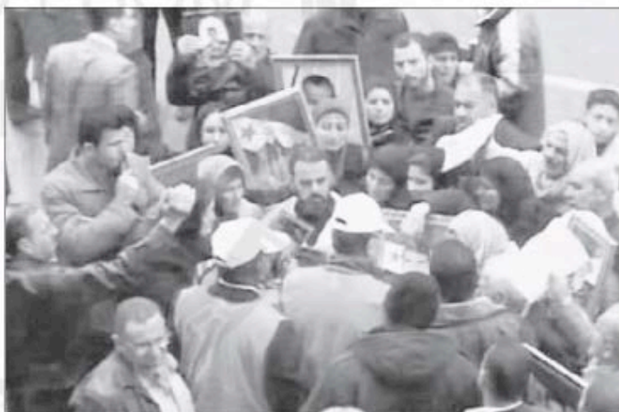
ARAB LEAGUE OBSERVERS , in baseball caps, talk to Syrians on Sunday in the northern province of Idlib in an image taken from television and released Monday.

Elaraby defended the league's efforts, saying tanks and other military vehicles had pulled back to the outskirts of cities and residential areas, food aid had been